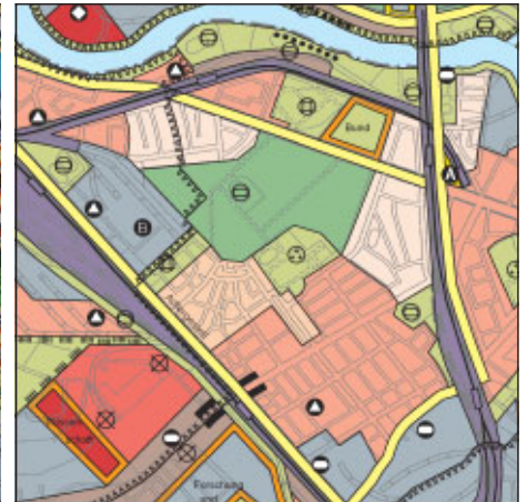
FNP Berlin (Stand Oktober 2004) 1:50.000