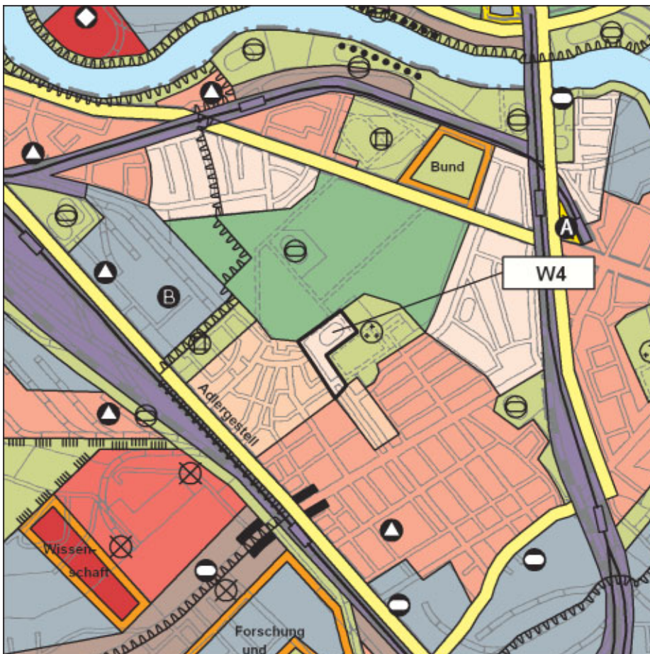
FNP-Änderung (wirksam mit Bekanntmachung im Amtsblatt) 1:25.000

Nach Aufgabe der Sportnutzung an diesem Standort soll in Ergänzung bestehender Siedlungsbereiche Flächenvorsorge im Rahmen der Eigentumsförderung getroffen werden.